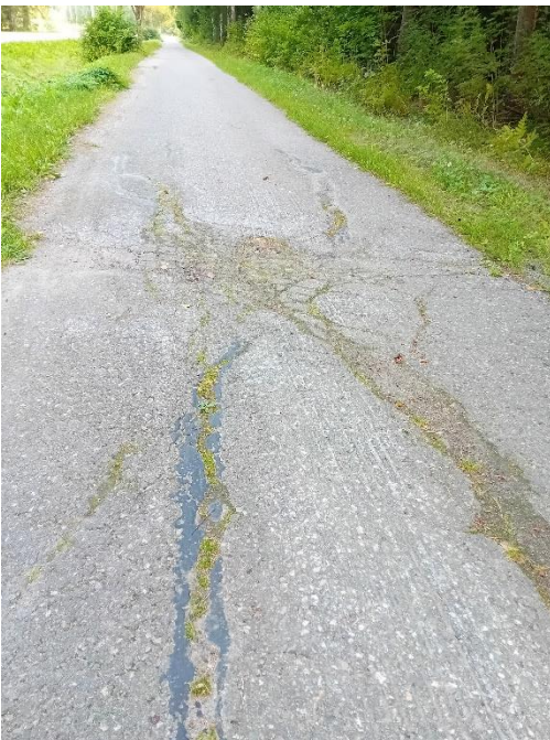
Kuvassa 3 näkyy tiessä oleva monttu.