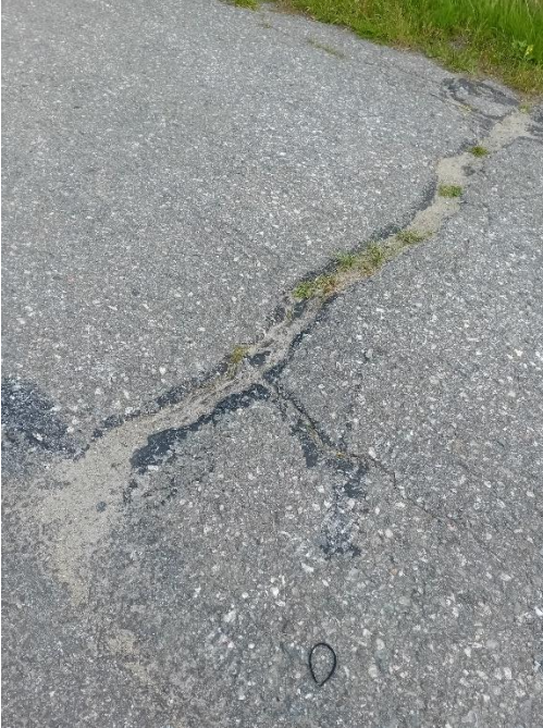
Kuvassa 1 näkyy tiessä oleva railo.