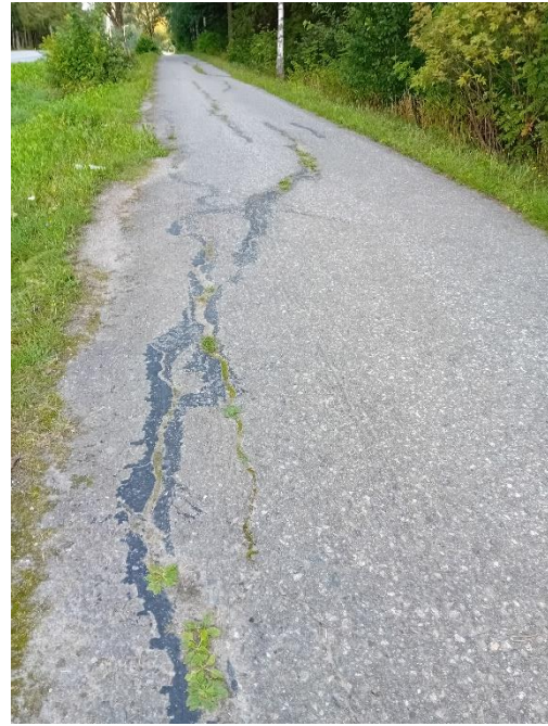
Kuvassa 2 näkyy tiessä oleva railo.