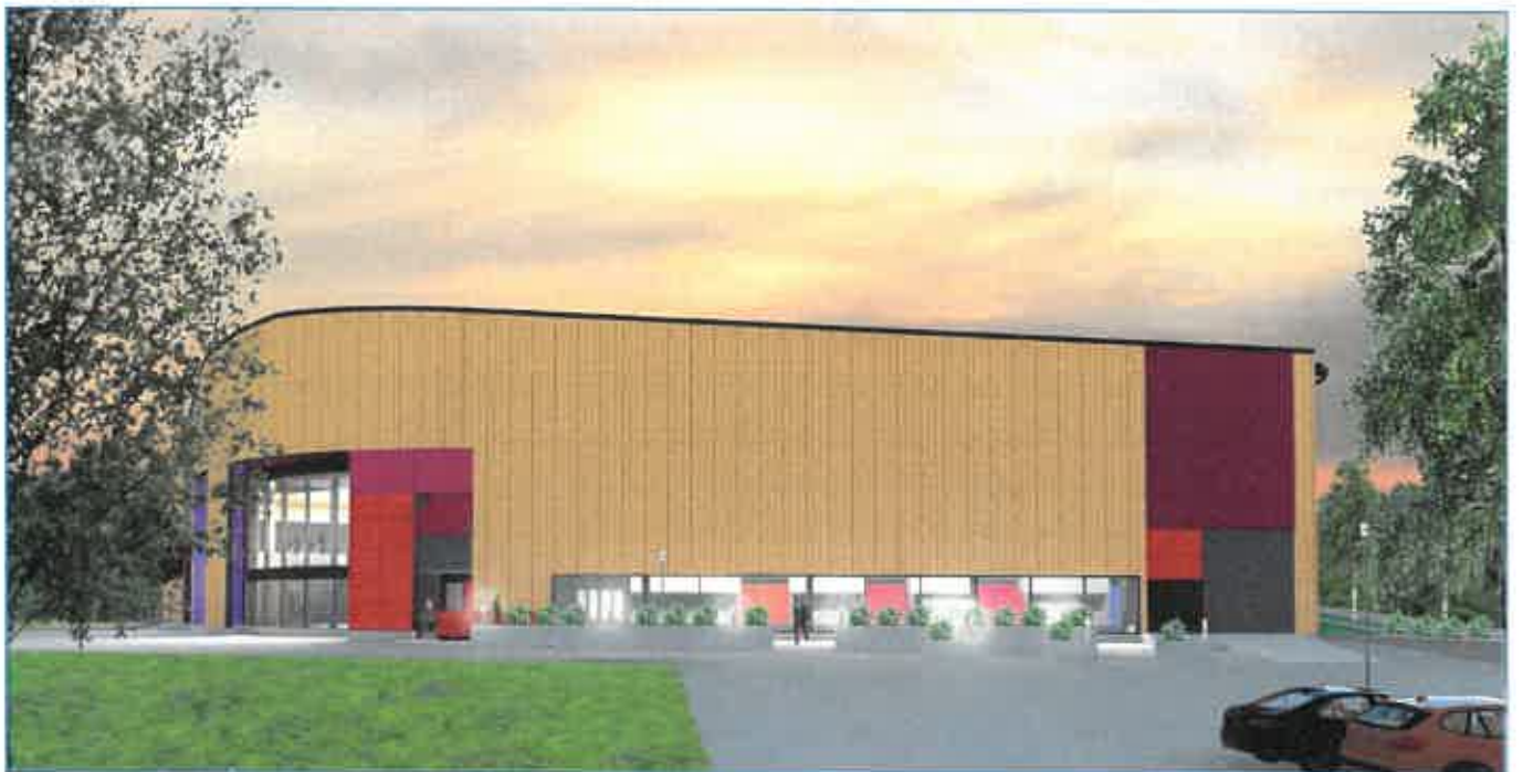
1 Havainnekuva Onkkaalan liikuntakeskus, Arkkitehtitoimisto Raudasoja Oy