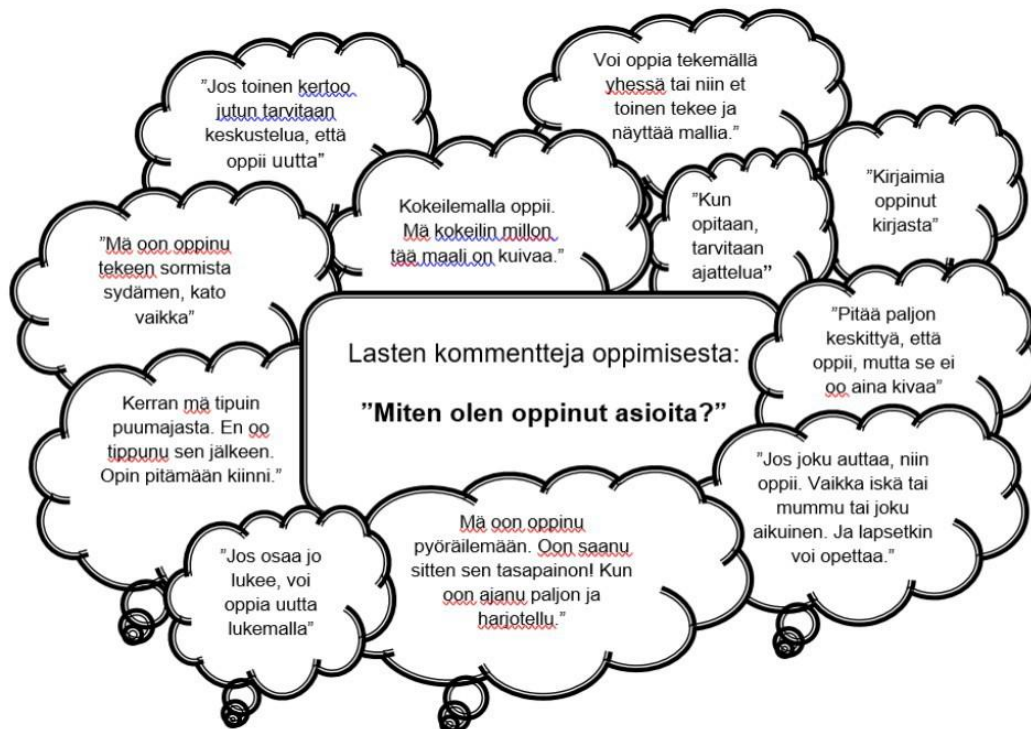
Pätkäneen lasten kommentteja oppimisesta "Miten olen oppinut asioita?"

Rakennamme oppimisympäristöä yhdessä lasten kanssa siten, että siinä näkyy lasten oma kulttuuri ja heidän näkemyksensä maailmasta, kauneudesta ja ympäristöstä. Tarjoamme leikkivälineitä ja erilaisia materiaaleja lasten saataville sekä mahdollistamme niiden monipuolisen käytön. Lapset omaksuvat opeteltavia asioita oman kiinnostuksensa kautta. Tavoitteellinen ja sopivasti haasteita antava toiminta ja ympäristö innostavat oppimaan lisää. Lapsi toimii oppimisympäristössään, jonka olemme muokanneet lapsen taitojen ja omien vahvuuksien mukaan.