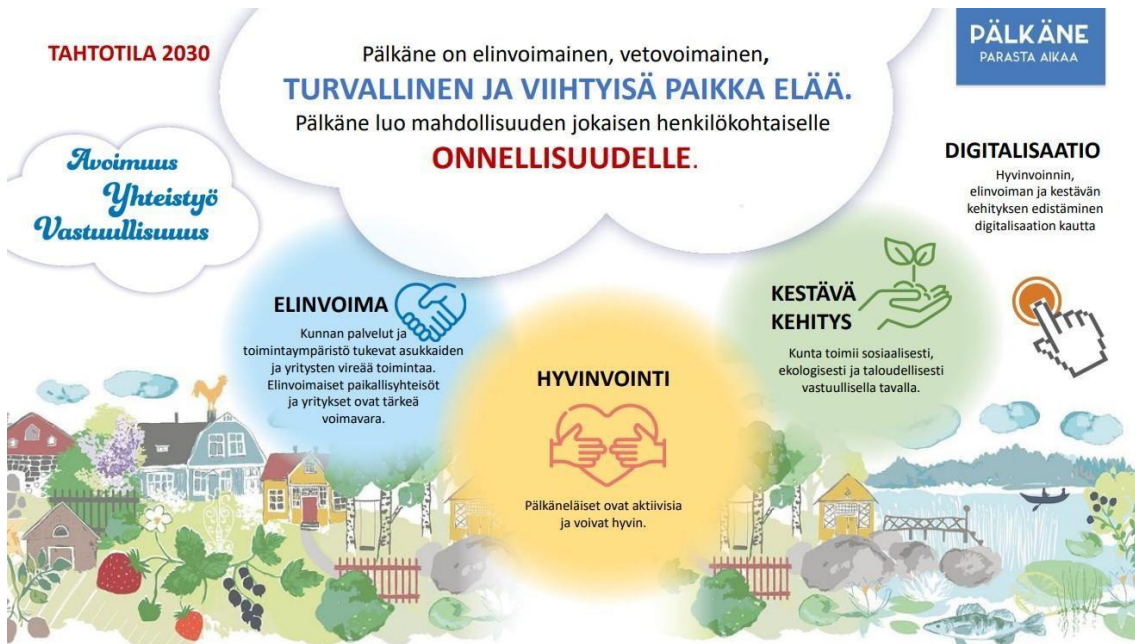
Pälkäneen kuntastrategia 2030

Pälkäneen kunnassa on päivitetty kuntastrategia vuonna 2021, joka on voimassa vuoteen 2030 asti. Pälkäneen kuntastrategian 2030 kokonaisuudessaan löydät täältä .