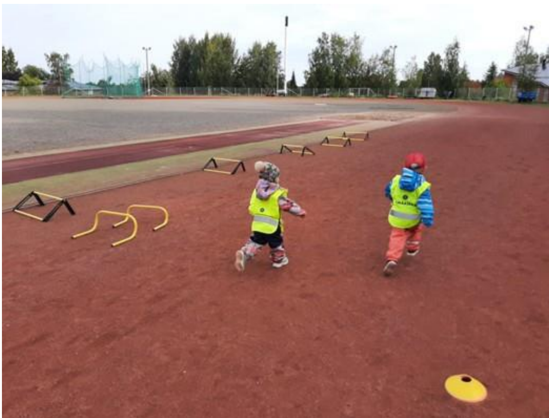
"Paikoillanne, valmiit, HEP!"

Liikkuva varhaiskasvatus -ohjelman tavoitteita tuemme myös erilaisten hankkeiden avulla. Hankkeiden (mm. Parkour, tanssipaja) tavoitteena on saada lapsia ja heidän perheitään innostumaan uusista lajeista sekä viettämään liikunnallista aikaa yhdessä. Perheiden yhteistä liikkumista tuemme haastamalla perheitä liikkumaan yhdessä ja hyödyntämään matkat aktiiviseen liikkumiseen. Liikunnan merkityksestä keskustelemme perheiden kanssa lasten varhaiskasvatussuunnitelmakeskusteluissa.