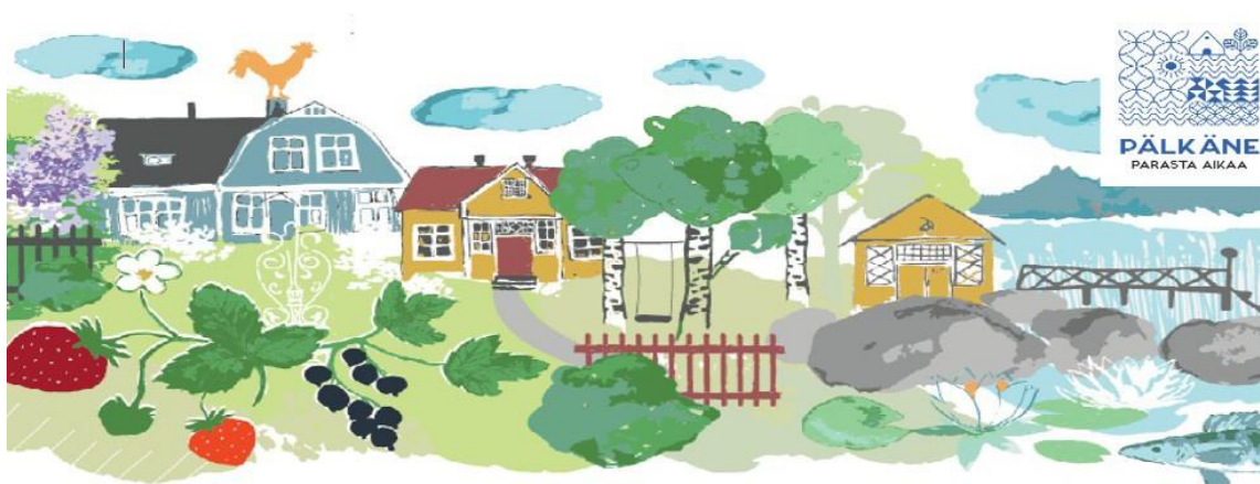
Pälkäne parasta aikaa

Varhaiskasvatussuunnitelmakokonaisuus on kolmitasoinen. Se koostuu valtakunnallisesta varhaiskasvatussuunnitelman perusteista, paikallisista varhaiskasvatussuunnitelmista sekä lasten varhaiskasvatussuunnitelmista.