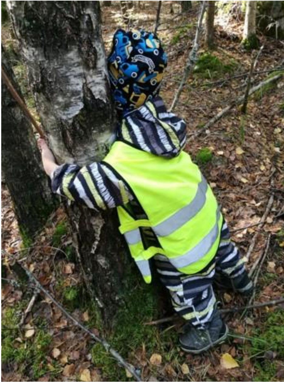
"Metsä hoivaa ja rauhoittaa"

Luonnossa toimimisen tueksi varhaiskasvatukselle laaditaan oma ympäristökasvatussuunnitelma vuoden 2022 aikana. Suunnitelmassa muun muassa esitellään lähiseudun retkikohteita, materiaalivinkkejä sekä vuosikello, jonka avulla voimme toiminnassa huomioida erilaisia teemapäiviä sekä –viikkoja. Suunnitelmassa huomioimme ympäristökasvatuksen ulottuvuudet; oppimisen ympäristöstä ja ympäristössä sekä toimimisen ympäristön puolesta.