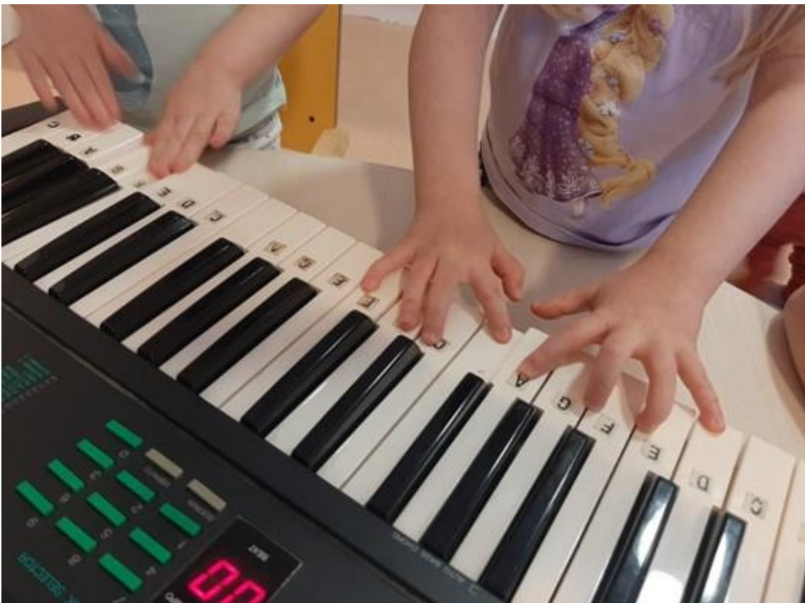
"yksin ja yhdessä kaverin kanssa sooloillen"

Tarjoamme lapsille kokemuksia eri aistien kautta ja hyödynnämme moniaistisia menetelmiä kuten laulu- ja tanssipiirtäminen. Ilmaisussa kiinnitämme huomiota erilaisiin tunteisiin ja aistimuksiin (miltä liima tuntuu sormissa, miltä taikina tuoksuu tai mitkä tunteita värit tai jokin kuva herättävät). Lasten kanssa tutkimme värejä, muotoja ja materiaaleja niin rakennetussa kuin rakentamattomassa ympäristössä.